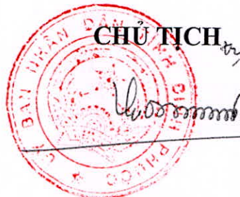
Trần Tuệ Hiền