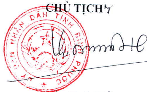
Trần Tuệ Hiền