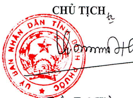
Trần Tuệ Hiền