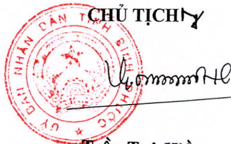
Trần Tuệ Hiền